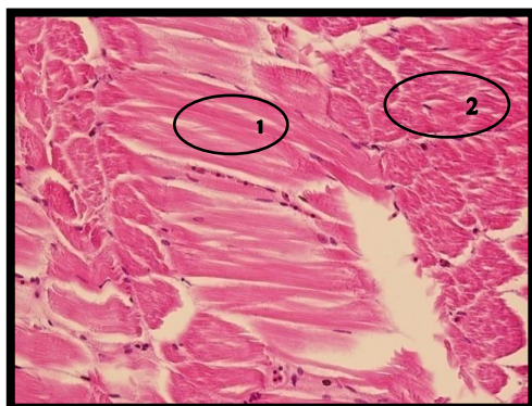
Gambar 1. Struktur jaringan otot normal pada ikan lele. (1) otot halus, (2) otot lurik. Perbesaran mikroskop 400x, potongan horizontal.

Dalam penelitian ini, kondisi otot ikan lele kontrol menunjukkan kondisi jaringan normal (dapat dilihat pada gambar 1), dengan tampilan struktur jaringan yang ketat/kompak. Posisi otot lurik dan otot polos juga muncul secara teratur tanpa kerusakan.